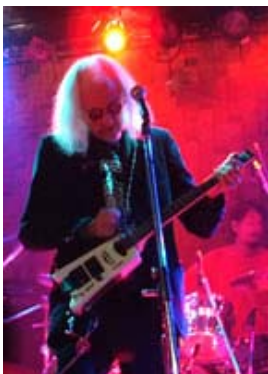
DAEVID ALLEN (1938)

Daavid Allen , Bert Camembert ou Dingo Virgin, é um guitarrista, compositor, vocalista e artista performático, mais conhecido por ter sido o co-fundador das bandas de rock psicodélico SOFT MACHINE (na Inglaterra, em 1966) e GONG (na França, em 1970), continuando com esta última até hoje. Ele é algumas vezes creditado como " Daavid Alien ". Ele mora atualmente em Byron Bay, Austrália.